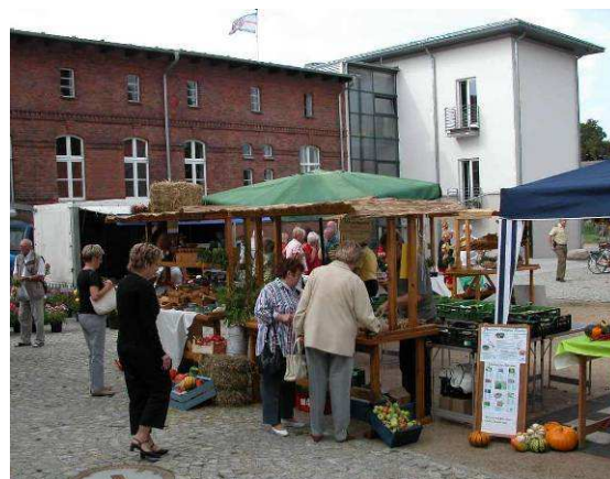
Pommerscher Bauernmarkt im Vierseithof / Pomorski rynek rolny w Vierseithof

No i oczywiście słowo kluczowe dywersyfikacja: nasi rolnicy muszą znaleźć niszę na produkty, na które istnieje zapotrzebowanie na rynku... Jak by to było w tym przypadku np. z jagodami???