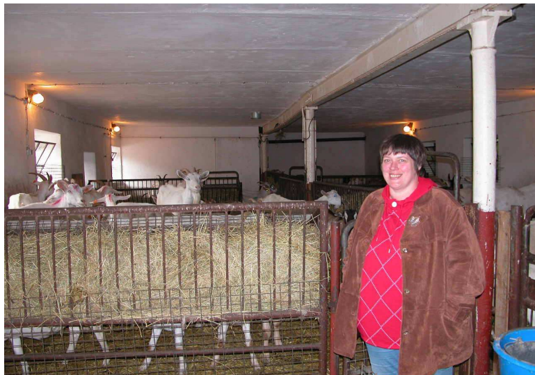
Ökologische Ziegenzucht in Wolczkowo / Ekologische Ziegenzucht in Wolczkowo

Gemeinsame Unterstützung der Vermarktung im Nachbarland und Möglichkeiten des Absatzes der Produkte über die Frischemärkte in den Städten und Gemeinden haben alle Beteiligten als gemeinsames Ziel vereinbart.