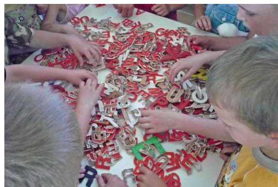
Wie Einzelnes zueinander findet... 1

szkół podstawowych, w których w przyszłości nauczane będą przedmioty wychowanie w sztuce, muzyce i sporcie, obecnie jednak przeznaczają się na nie 1 godz. tygodniowo (co nie wystarcza), powinny być zespolone do jednej godziny tygodniowo z tytułem "wychowanie estetyczne". Dalsze życzenia: aby wszystkie dotychczasowe dzieci Akademii Dziecięcej mogły przypomnieć sobie za 10 czy 20 lat o ich czasie spędzonym tutaj, który spędzili intensywnie przyglądając się swojej twarzy, muzyce Vivaldi, stopniami życia Caspara-Davida-Friedricha, w grze przyjaźni, w mieszance kolorów tęczy oraz przy Qi-Gong.