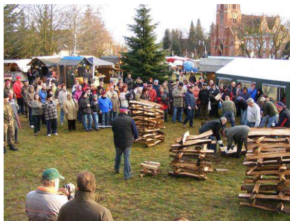
Brennholztag in Eggesin 1 / Dzień drewna w Eggesin 1

Während Papa sich die Maschinen zur Holzverarbeitung anschaut, konnte Mutti in Ruhe Weihnachtliches einkaufen. Anschließend traf man sich beim Glühwein wieder, die Romantik der Feuerstellen am Adventsabend taten ihr übriges...und seit dem gibt es eben den etwas anderen Adventsmarkt in Eggesin.