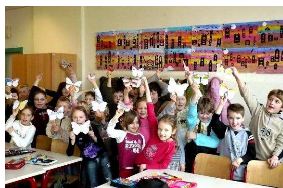
Stolze Ergebnisse der Grundschüler/ Dumne wyniki pracy uczniów szkoły podstawowej

Irgendwann kommen die Kinder aus der Kita in die Schule – und mein erklärtes Ziel ist die Nachhaltigkeit meiner Arbeit. Das bedeutet, dass die Kinder-Akademie-Werkstatt mit ihren vielfältigen kreativen und geistigen Angeboten zum erinnerungsfähigen Element einer "sozial kompetenten" Kindheit und Jugend werden könnte, um die künftigen Einstellungen zum eigenen Leben und zur Welt stärken wie auch sensibilisieren zu helfen.