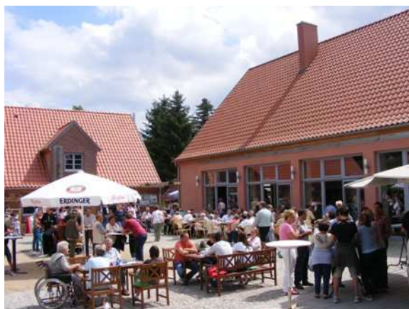
Blaubeerfest im Vierseithof / Święto jagody w Vierseithof

Pierwsze święto jagody odbyło się w lipcu 2004. Zorganizowane w przeciągu czterech tygodni, było to małe, ale ładne święto z około 100 uczestnikami. Już wtedy szczególna atmosfera przyciągnęła uwagę wielu zwiedzających. Ukoronowana została pierwsza "królowa jagód", która później miała reklamować region nad Zalewem Szczecińskim w całych Niemczech a obecnie jej druga następczyni pełni tę funkcję z sukcesami. Tymczasem liczba odwiedzających święto jagody wzrosła dwudziestokrotnie, odsetek turystów zewnętrznych wynosi 70%. Wyszukany program, uroczy rynek z produktami regionalnymi oraz zabawy rodem z Pomorza, tylko w tym roku sprzedano podczas festynu 1500 kawałków ciasta jagodowego, to wszystko sprawia, że to święto jest jedyne w swoim rodzaju.