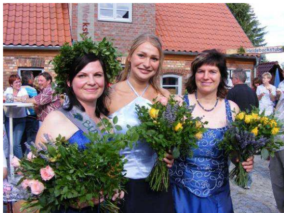
Drei Generationen der Blaubeerkönigin / Trzy generacje królowych jagód

rodzaju z bogatą ofertą i jego dumnymi mieszkańcami.