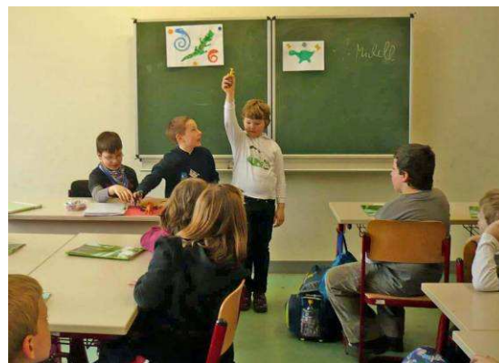
Kinder unterrichten Kinder / Dzieci nauczają dzieci

schluss stehen zusammenfassende Ausstellungen und Museumsbesuche in Greifswald auf dem Plan, und jedes Kind erhält am Ende ein Kinder-Akademie-Zertifikat. In der Grundschule, in den Religionersatz- Klassen 2 a und 2 b mit 28 Schülern, die ich seit der Vorschule kenne und in der "Die Elemente meiner Welt" behandelt werden, haben wir mit Erfolg die Unterrichtsmethode "Kinder unterrichten Kinder" erprobt.