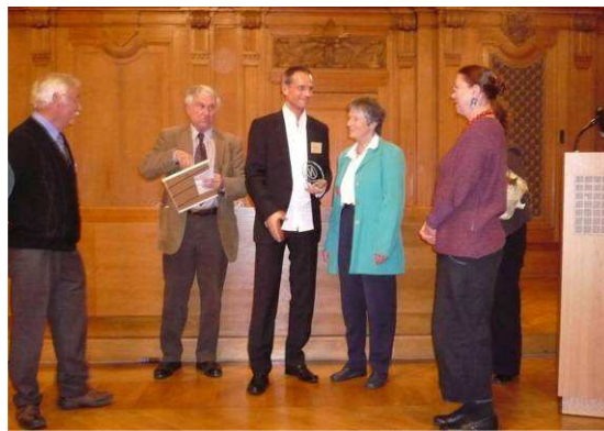
Preisverleihung 2008 in Leipzig 1/Rozdanie nagród 2008 w Lipsku

Diese Frage ist fast schon beantwortet. Für die Kinder sind die Angebote bisher stets kostenlos gewesen. Ich kann es mir auch nicht anders vorstellen. Die Kinder-Akademie ist auf Projektförderung angewiesen. Nachhaltigkeit der Projekte und Nachhaltigkeit der Finanzierung stehen im krassen Ungleichgewicht. Die durch den Deutschen Lokalen Nachhaltigkeits-Preis 2008 ausgezeichnete Nachhaltigkeit in meinen Projekten ist überwiegend ein Kind des Ehrenamtes.