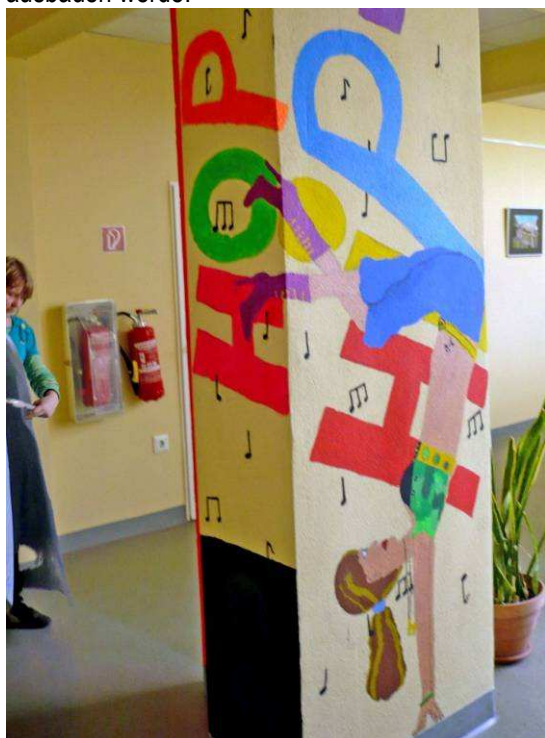
Säulengestaltung im Eingangsbereich der Schule/ Wymalowanie filarów przy wejściu do szkoły

(Ich male mein eigenes Denkmal), Entwicklung einer eigenen Zeichen-Sprache anhand einiger ausgewählter japanischer oder chinesischer Zeichen, Koordinierungs- und Qi-Gong-Übungen, Elemente- und Naturlehre (Ich stelle mir vor: Ich bin ein Baum). Die Kinder erfahren etwas über Leben und Werk vom Künstlern und Komponisten ebenso wie über ihren eigenen Ort in der Welt und legen sich in 10-20 Werkstatttreffen ihr eigenes Ichbuch als Erinnerungsbuch an, das auch ihre Familie, Freunde, Lieblingsdinge, Lieblingstiere mit einschließt. "Elementarphilosophisch" werden die selbstverständlichsten Dinge befragt wie "Was ist eine Familie, Was alles gehört zu einem Baum – und was hat er mit mir zu tun? Wie hängen die 4 Jahreszeiten mit den 4 Himmelsrichtungen und den 4 Elementen zusammen? Wo stehe ich in der Welt?" etc. Wenn eine Blumenwiese, ein Baum, ein Unterwasserbild gemalt werden, so erarbeiten sich die Kinder ihre Zusammensetzung und Entwicklungsbedingungen in der Natur und berichten über ihre eigenen Erfahrungen damit. Schließlich biete ich das Präventionsprojekt "Kopf-Hand-Fuß" an, das mir sehr am Herzen liegt und das ich aufgrund der bisherigen und künftigen Erfahrungen mit den Kindern weiter ausbauen werde.