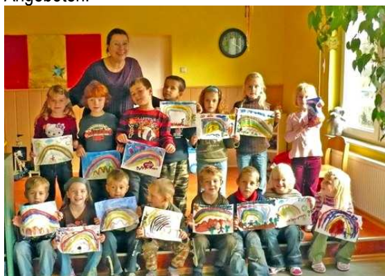
Arbeit mit einer Kitagruppe 1/ Praca z grupą dzieci

in der "Modellregion" Uecker-Randow wagen sollte, die mir ja seit den Zeiten des Aufbaus und meiner Koordinationsarbeit der Jugendclubs in den 90er Jahren vertraut ist. Auslöser der Entscheidung jetzt also war ausgerechnet eine Krankheit, die mich an die Grenze der Arbeitsunfähigkeit gebracht hatte. Der Neubeginn: voller Zuversicht, Hoffnung, in positiver Lebenshaltung. Mir war es wichtig, all mein bisher erworbenes Wissen, meine Erfahrungen in diese neue freischaffende Arbeit mit jungen Menschen münden zu lassen. Ich gründete die Kinder-Akademie im ländlichen Raum und begann zunächst mit Kita-Mittelgruppen- und Vorschul-Angeboten.