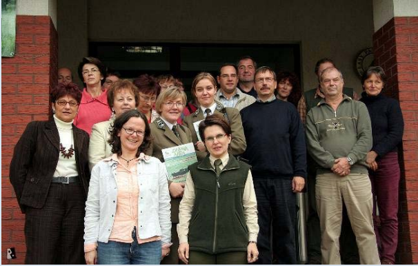
Gemeinsame Exkursion deutscher und polnischer Umweltbildungseinrichtungen 2006