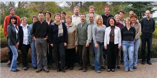
Die Gründung des Umweltbildungnetzwerkes Stettiner Haff mit 22 beteiligten Einrichtungen und Vereinen, Oktober 2007

Regelmäßige Seminare und Workshops sicherten durch Know-how-Vermittlung nachhaltige Projektstrukturen.