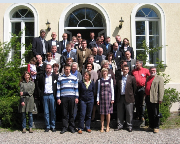
Deutsch-polnische Agendakonferenz in der Europäischen Akademie in Kulice; Mai 2009

Ausführliche Informationen und detaillierte Berichte finden Sie unter www.agenda21-oder.de !