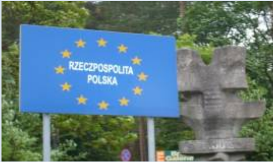
Polen gehört seit 2004 zur Europäischen Union