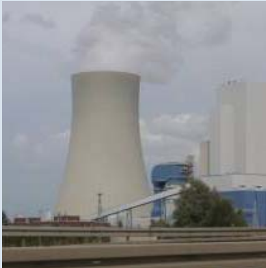
EGKS: Das Thema „Kohle“ ist auch heute sehr aktuell. Steinkohlekraftwerk in Rostock

So gab es den Warschauer Pakt als militärisches Gegengewicht zum westeuropäischen Bündnis, für die ökonomischen Bereiche insbesondere den Rat für gegenseitige Wirtschaftshilfe (RgW) und kleinere planwirtschaftliche Organisationen sowie die alle Bereiche umfassende Schlussakte der Konferenz für Sicherheit und Zusammenarbeit in Europa ( KSZE ), welche zum 1.1.1995 Organisation für Sicherheit und Zusammenarbeit in Europa ( OSZE ) umbenannt wurde.