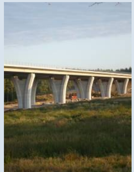
Die Regelungen für Vorhaben und Aktivitäten in der Natur sollten überall gleich sein.